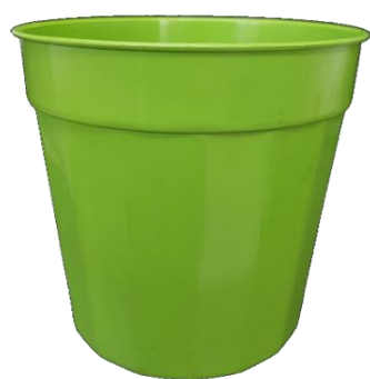
Vaso Plástico Capacidad: 600mL