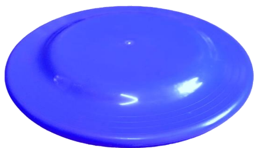
Frisbee Diámetro: 24cm