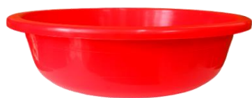
Palangana #12 Capacidad: 4 Litros