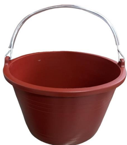
Balde Para Construcción Con Asa Metálica

Altura: 18cm Díametro: 24cm Capacidad: 7 Litros