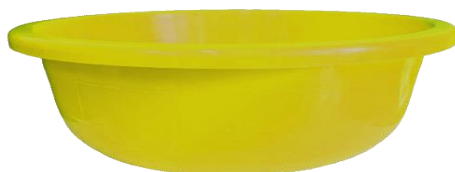
Palangana #14 Capacidad: 8 Litros