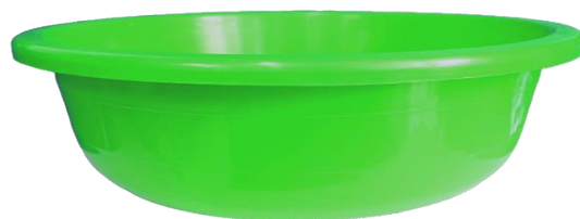
Palangana #16 Capacidad: 12 Litros