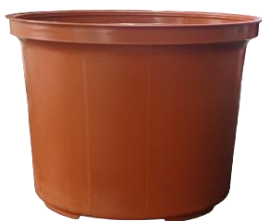
Maceta #14 - Modelo 2