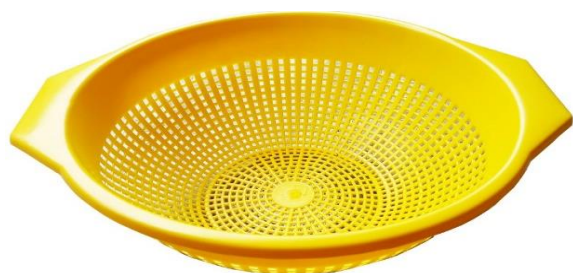
Colador Capacidad: 4Litros