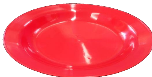
Plato 8.5" Capacidad: 600mL