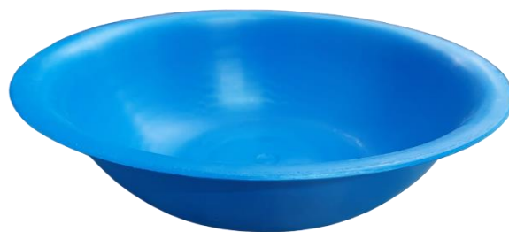
Ensaladera #10 Capacidad: 2.3 Litros