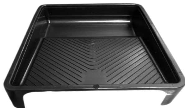
Bandeja Para Pintura Capacidad: 4 Litros

Altura: 18cm Díametro: 24cm Capacidad: 7 Litros